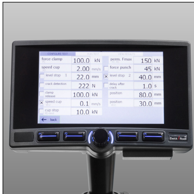
Display für BUP 400 / 600 / 1000 (1048583)